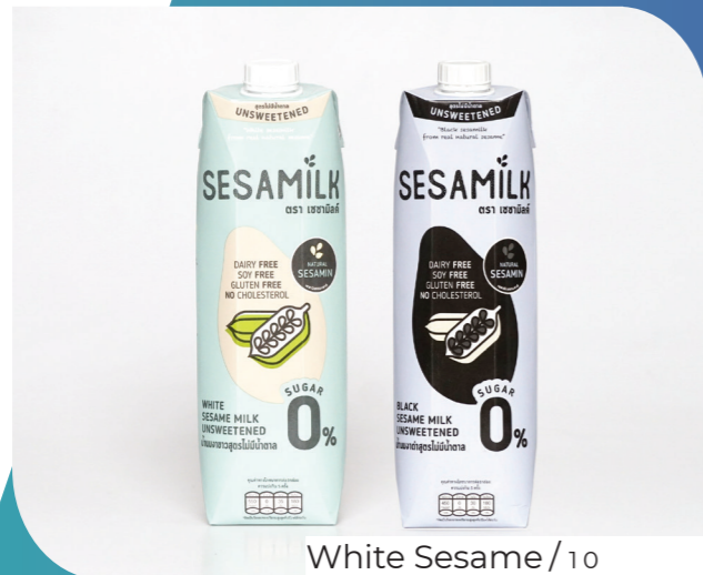
White Sesame / 10