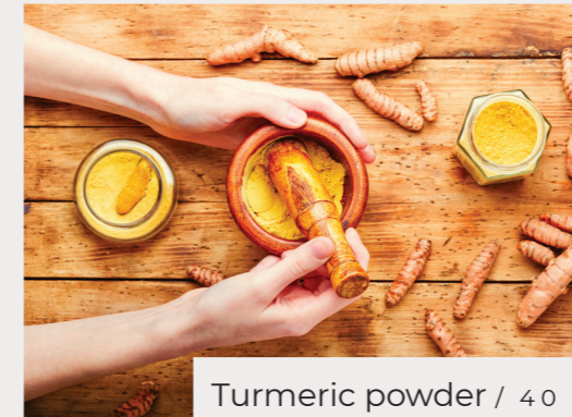
Turmeric powder / 40