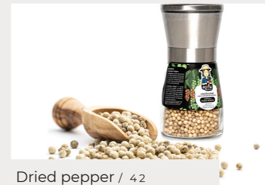
Dried pepper / 42