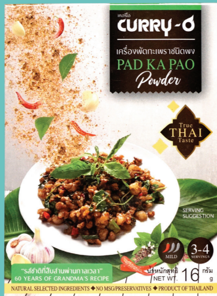
Ready-to-cook curry / 14