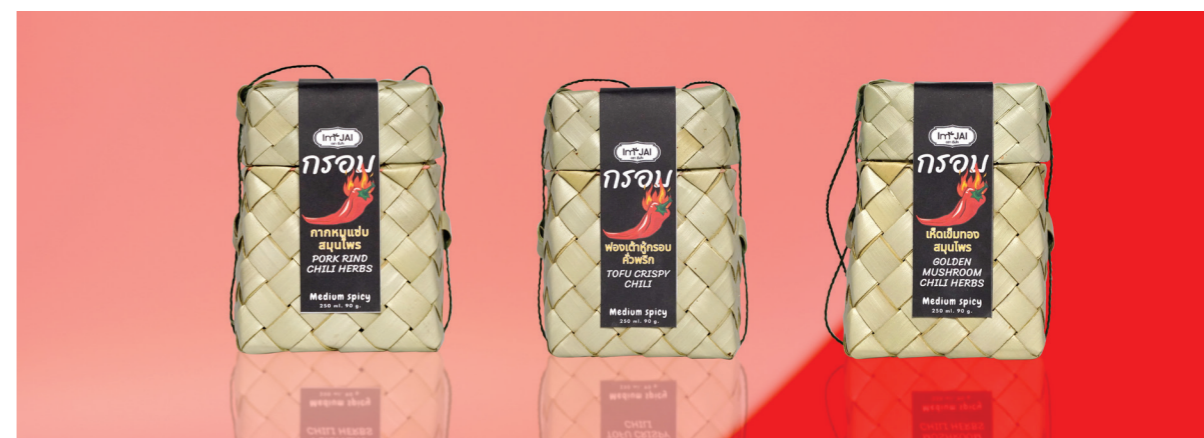
PORK RIND CHILI HERBS, TOFU CRISPY CHILI AND GOLDEN MUSROOM CHILI HERBS