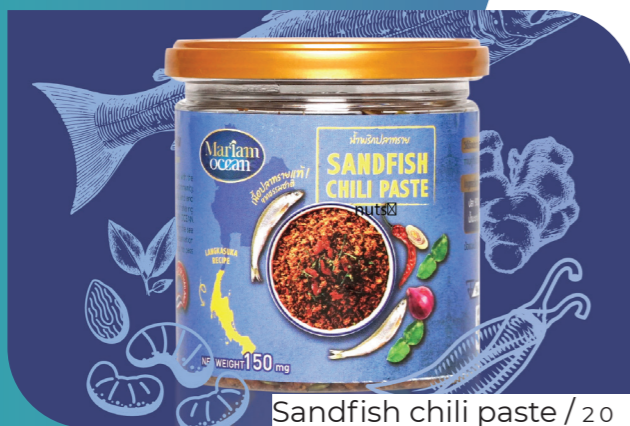
Sandfish chili paste / 20