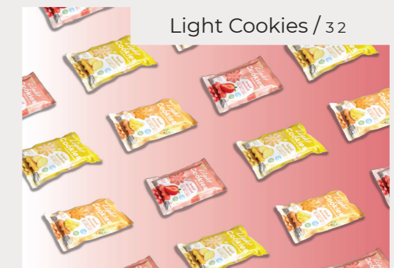
Light Cookies / 32